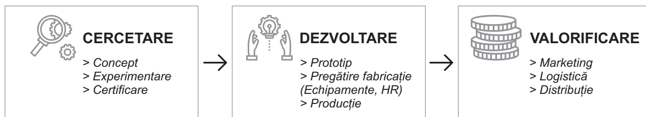
Fig. 2. Mecanismul de implementare a RIS3 Nord-Est

Proiectele integrate din cadrul portofoliului RIS3 Nord-Est includ intervenții, de-a lungul întregului lanț valoric de inovare.